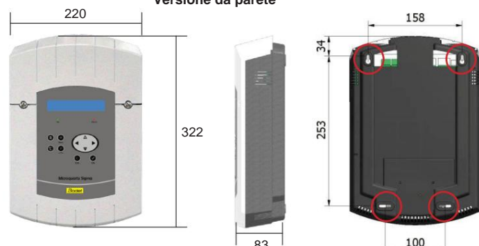
Versione da parete

Peso: 1,2 Kg - Fissaggio a parete con 4 viti.